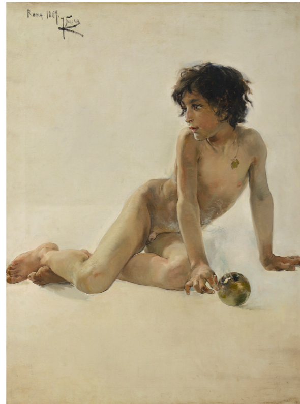
Joaquim Sorolla. El xiquet de la bola. 1887. Oli sobre tela. 98 x 72 cm

Ontinyent. Casa de Cultura Palau dels Barons de Santa Bàrbara